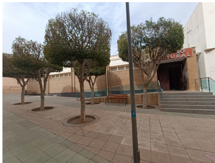
Vista fachada desde plaza