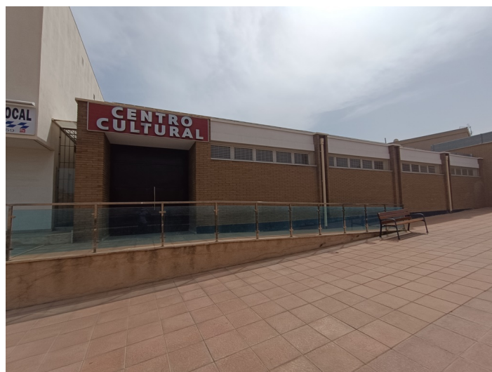
Vista fachada entrada