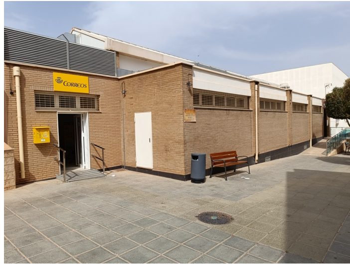
Vista fachada detalle correos