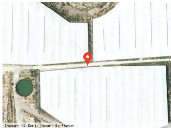
Imagery © 2025 Maxar, Earthstar Vista Satélite (Zoom)