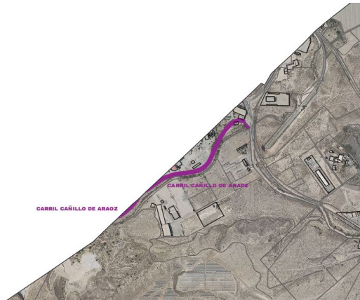
Carril Cañillo de Araoz