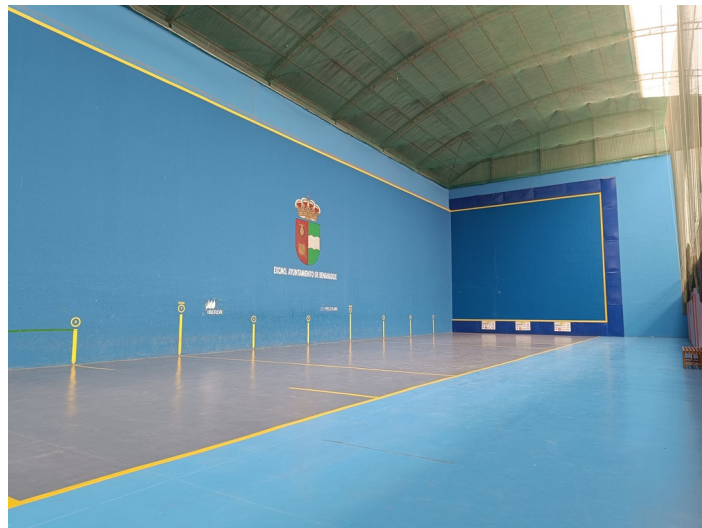
Frontón Municipal Cubierto / Pistas de Pádel