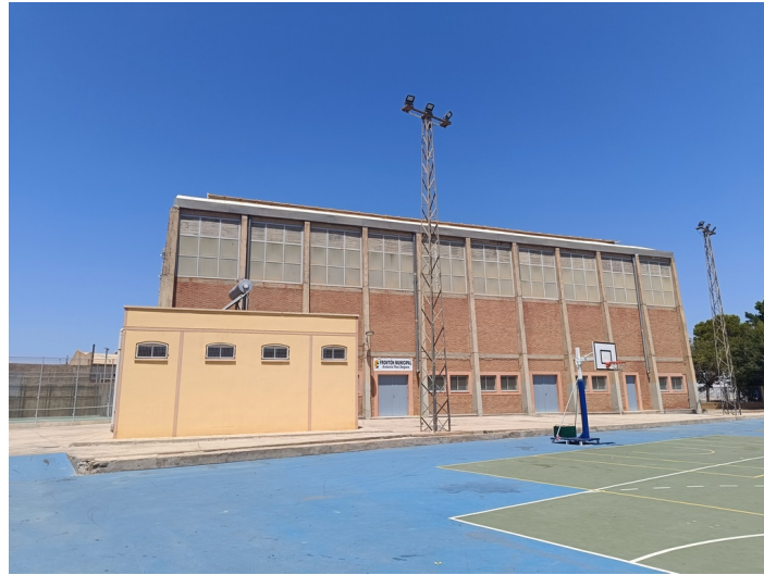
Frontón Municipal Cubierto