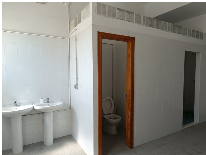
Frontón Municipal Cubierto / Pistas de Pádel