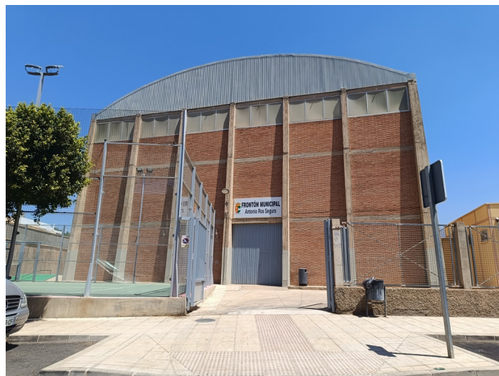
Frontón Municipal Cubierto