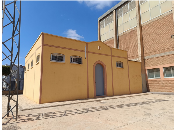
Frontón Municipal Cubierto / Pistas de Pádel