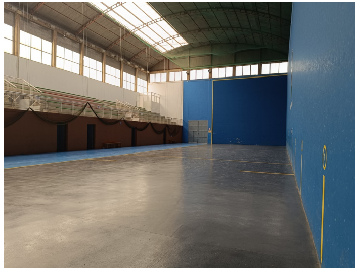
Frontón Municipal Cubierto / Pistas de Pádel