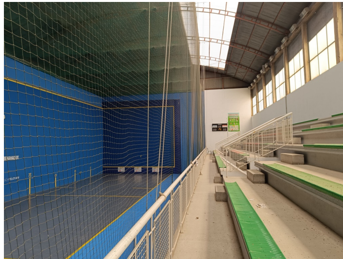
Frontón Municipal Cubierto / Pistas de Pádel