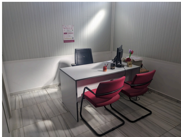
Despacho 1 P1