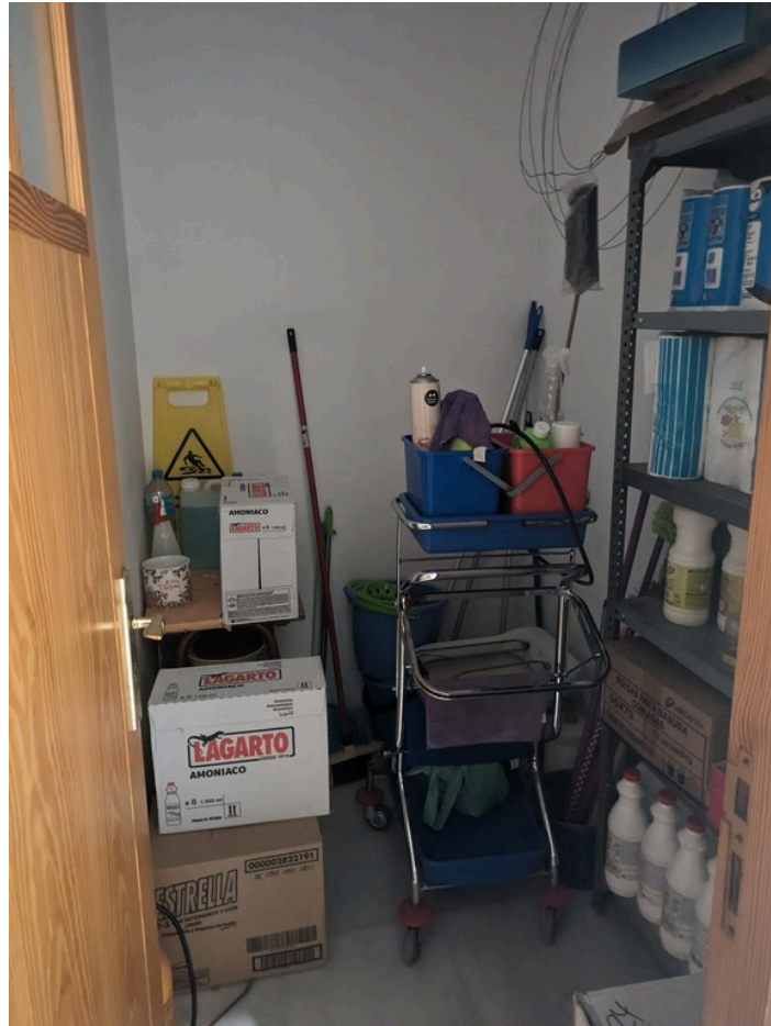
Cuarto de limpieza PB