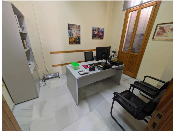
Despacho 2 P1