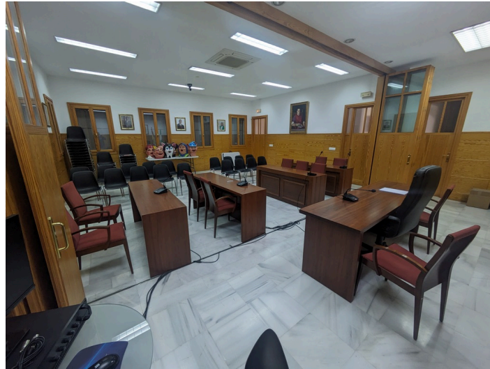
Salón de Plenos