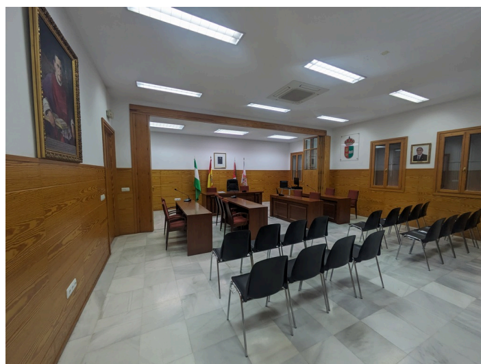
Salón de Plenos