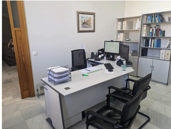
Despacho de Secretaría