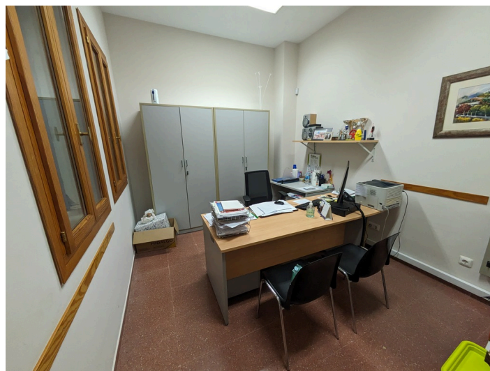
Despacho Promoción: Cultura, Deporte Juventud. PB