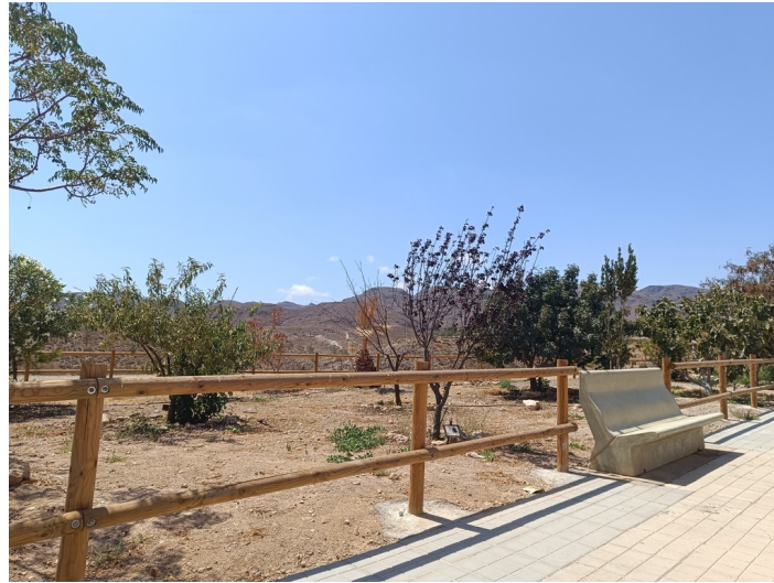
Zona verde - B