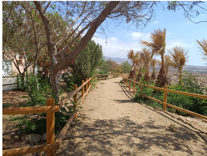
Zona verde - B