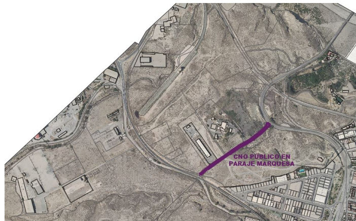
Camino público en Paraje Marquesa