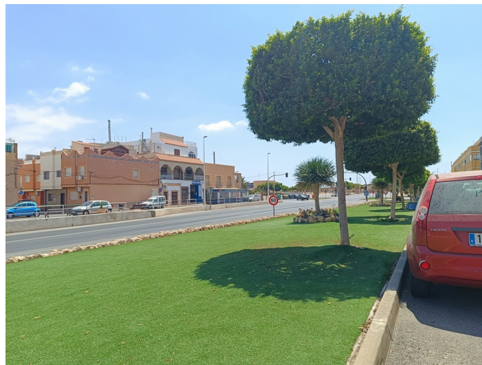
Zona verde A - sector I1 e I2