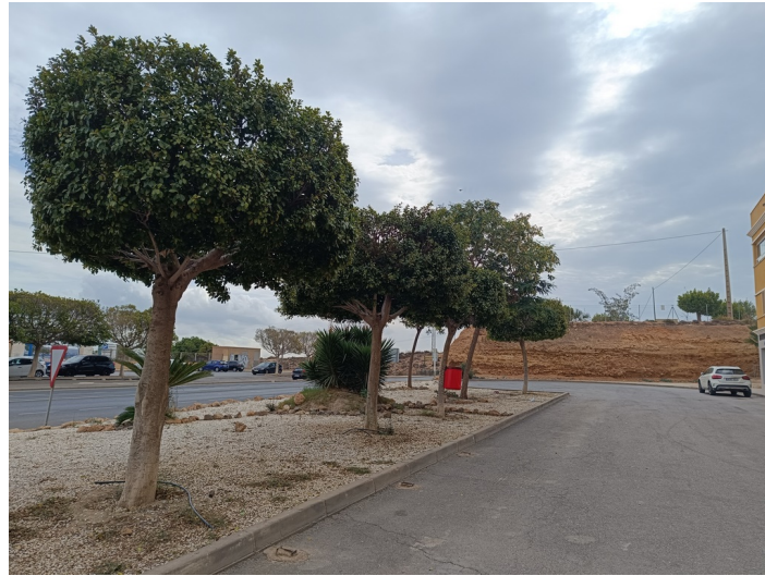
Zona verde B - sector I1 e I2