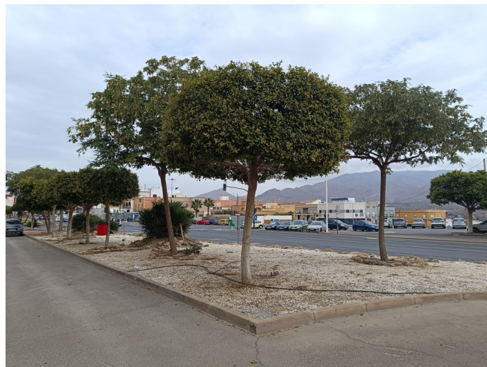
Zona verde B - sector I1 e I2