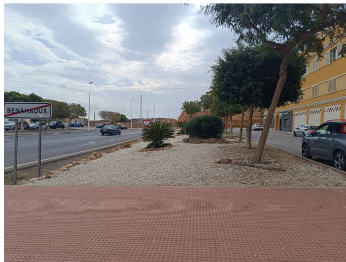
Zona verde B - sector I1 e I2