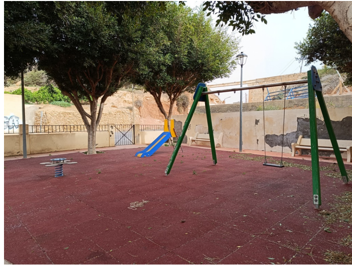
Vista interior del parque