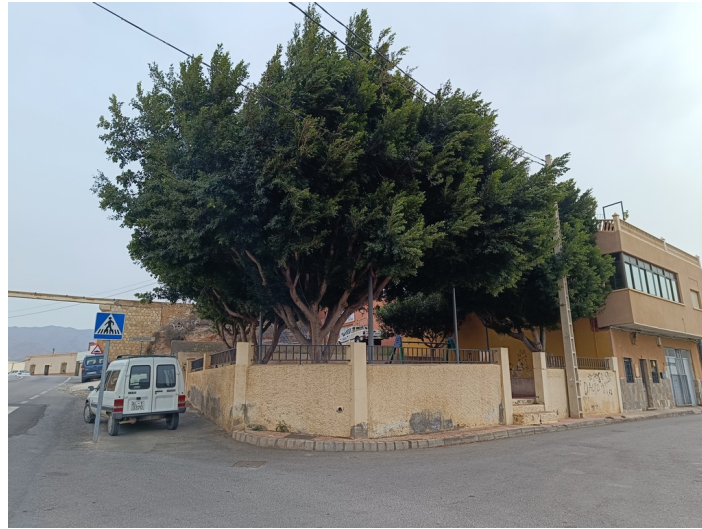
Vista exterior desde carretera