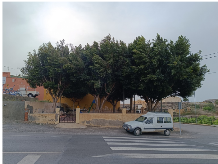
Vista exterior desde carretera