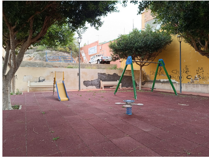
Vista interior del parque