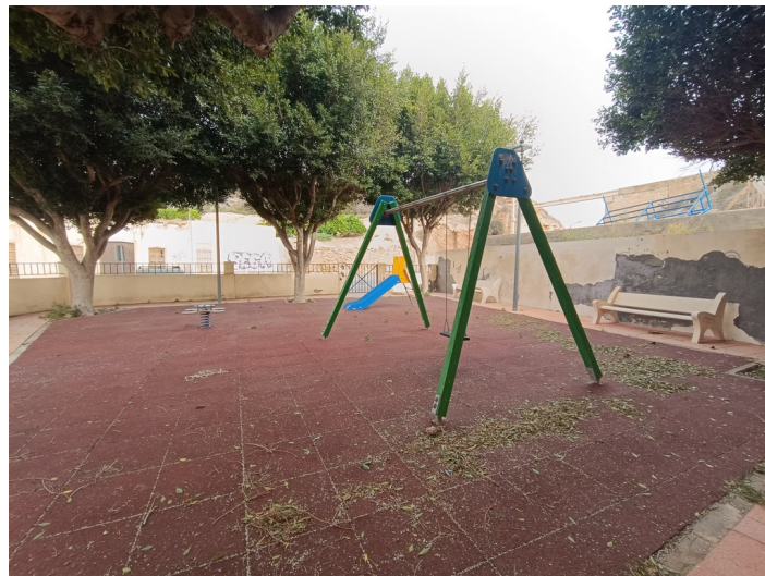
Vista interior del parque