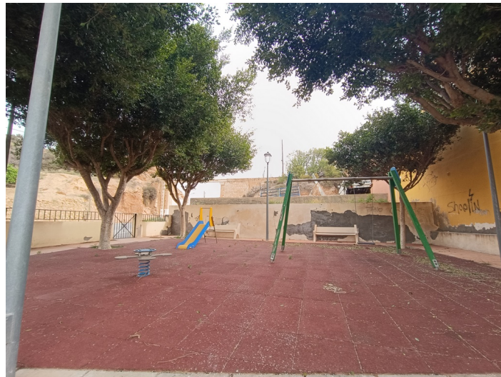
Vista interior del parque