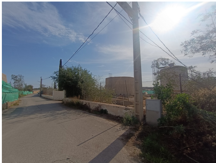
EDAR Estación Depuradora DS. CM Pechina