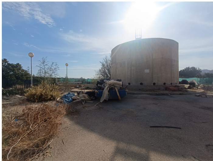
EDAR Estación Depuradora DS. CM Pechina