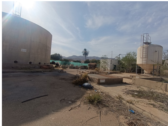
EDAR Estación Depuradora DS. CM Pechina