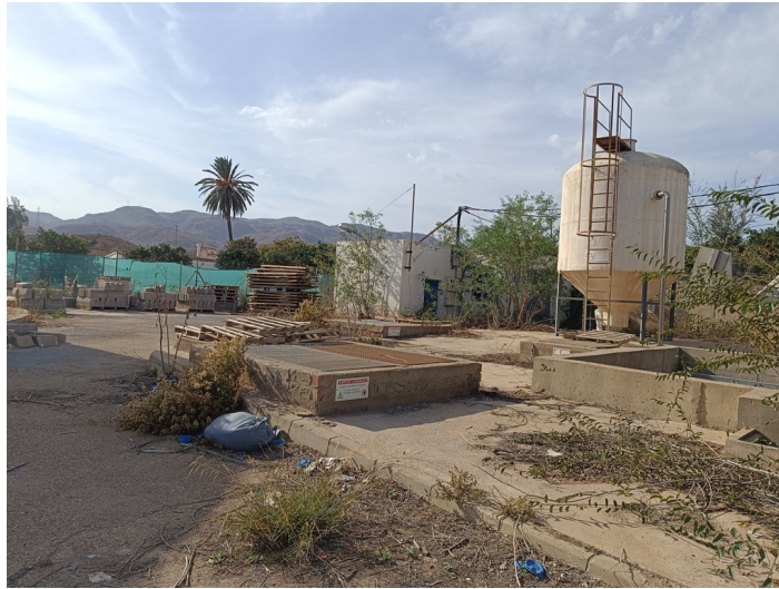
EDAR Estación Depuradora DS. CM Pechina