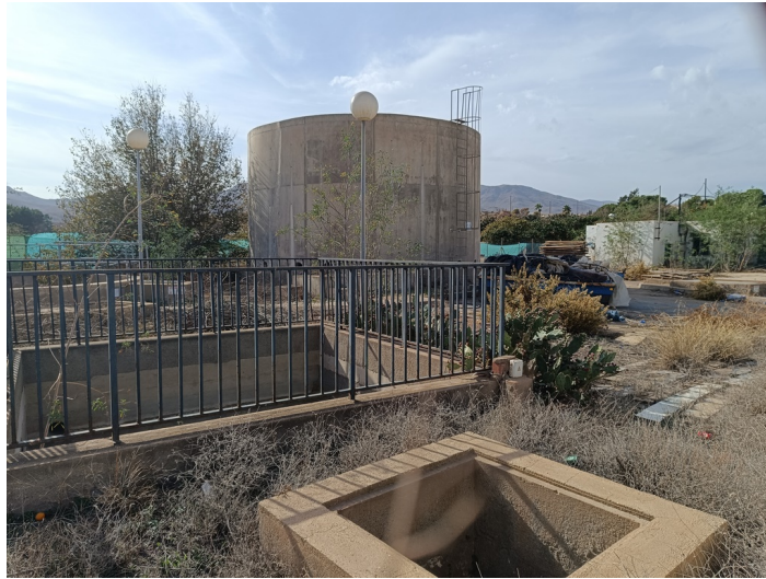
EDAR Estación Depuradora DS. CM Pechina