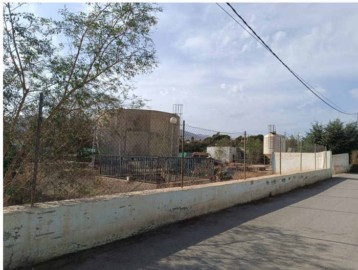
EDAR Estación Depuradora DS. CM Pechina