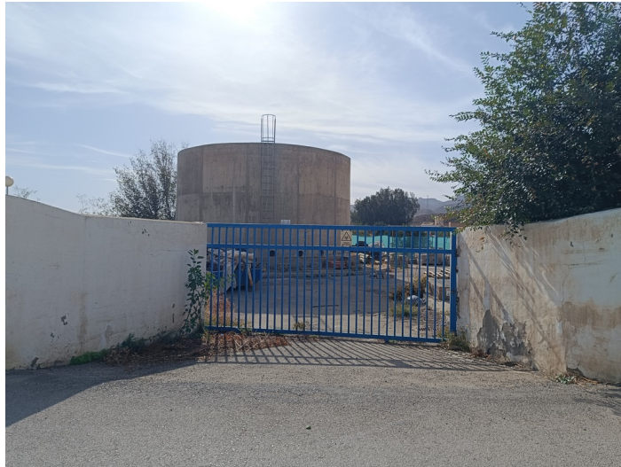
EDAR Estación Depuradora DS. CM Pechina