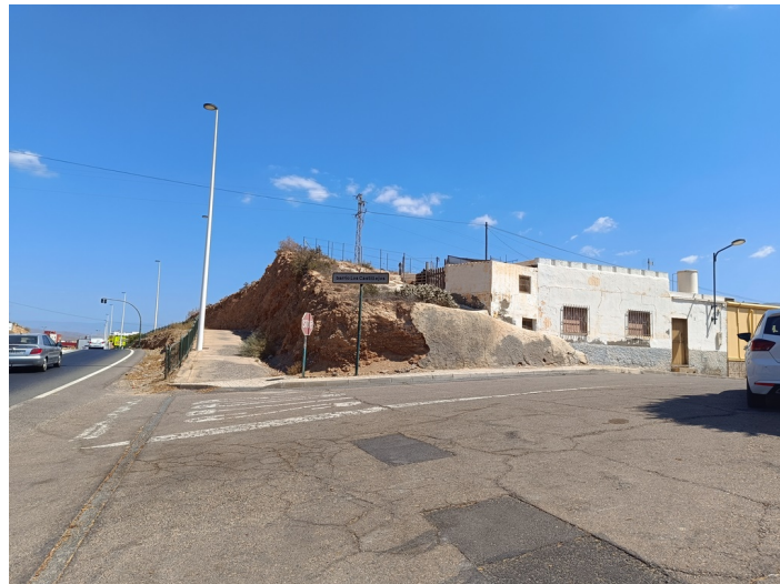
Solar Barrio Castillejos