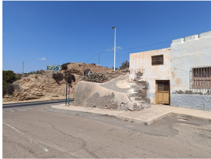
Solar Barrio Castillejos