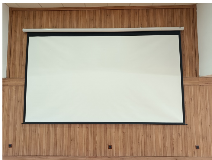
Vista de la pantalla del proyector