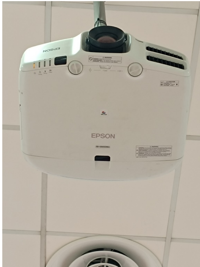
Vista detalle del proyector