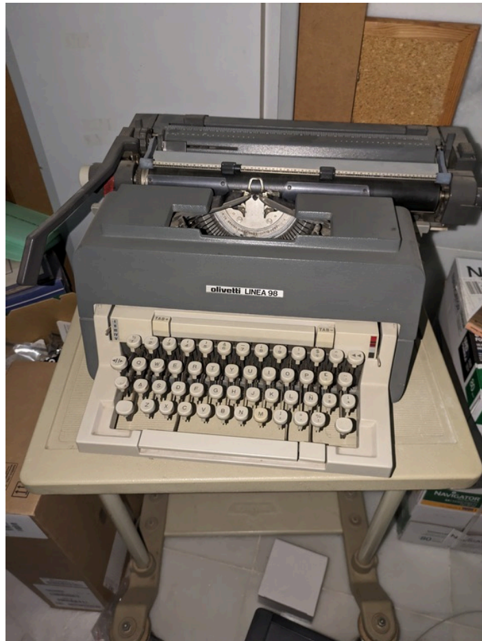
Vista general máquina