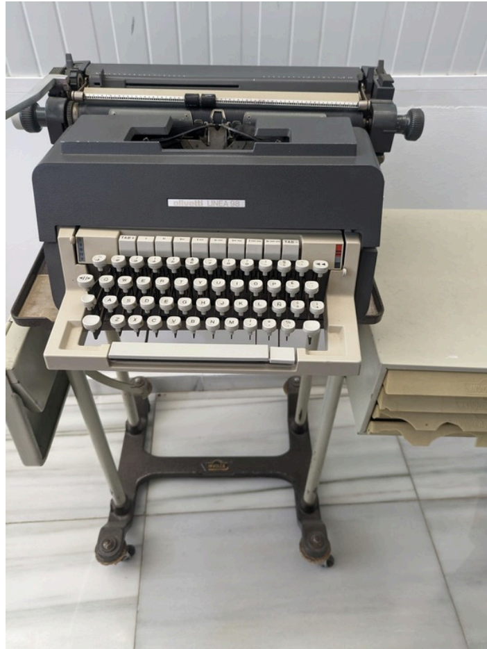
Vista general de la máquina de escribir