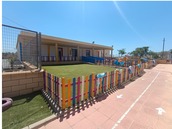
Terreno Guardería Infantil