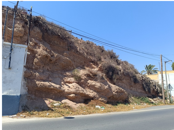
Solar Barrio El Chuche 84