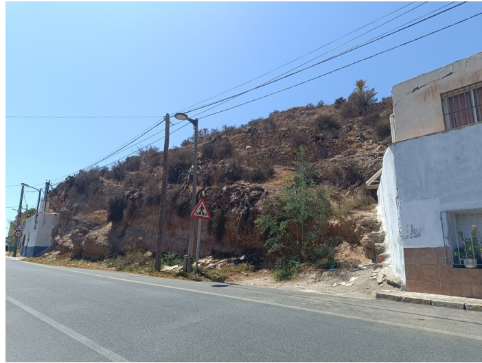
Solar Barrio El Chuche 84