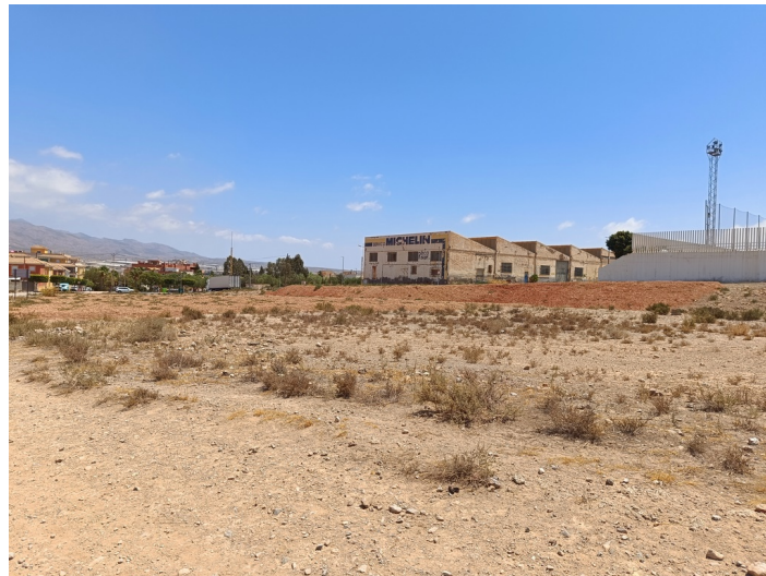
Solar en Calle Picasso 11