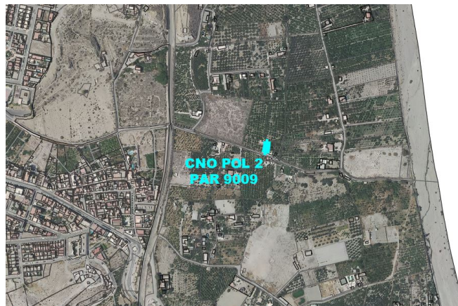
Camino Polígono 2 Parcela 9009