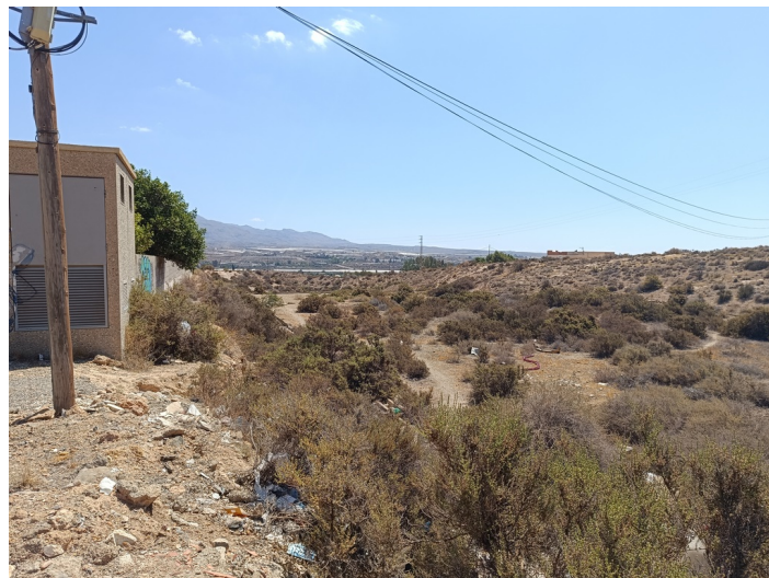
Terreno alrededor IES Aurantia (resto parcela descatalogada del monte N1 CUP.)