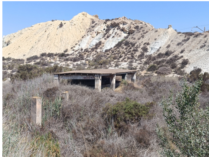
Lavadero El Chuche