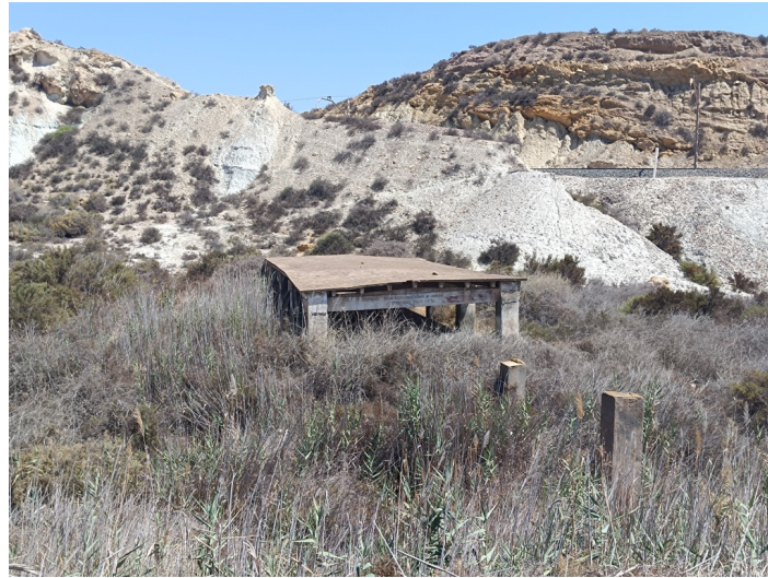
Lavadero El Chuche