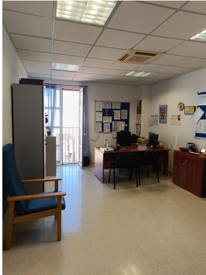
Conjunto mobiliario dirección Centro de Día Minerva