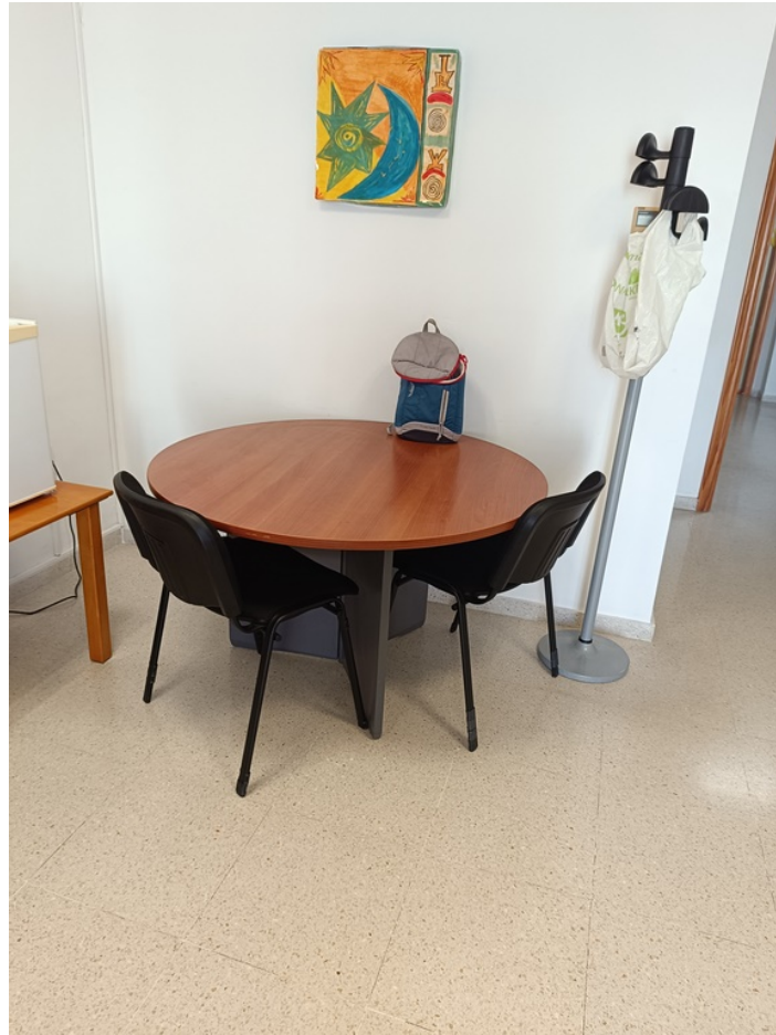
Conjunto mobiliario dirección Centro de Día Minerva