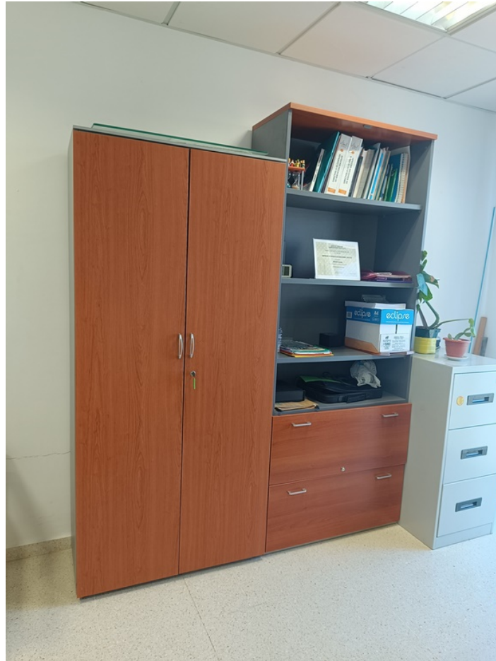
Conjunto mobiliario dirección Centro de Día Minerva