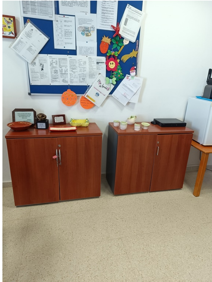
Conjunto mobiliario dirección Centro de Día Minerva