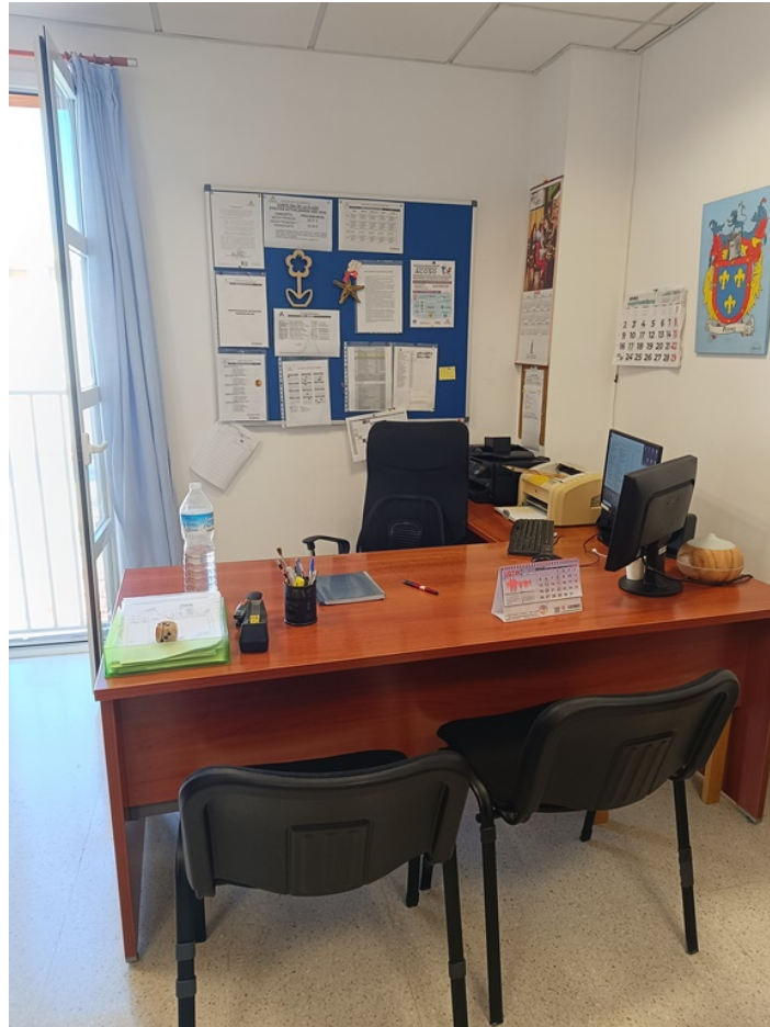
Conjunto mobiliario dirección Centro de Día Minerva