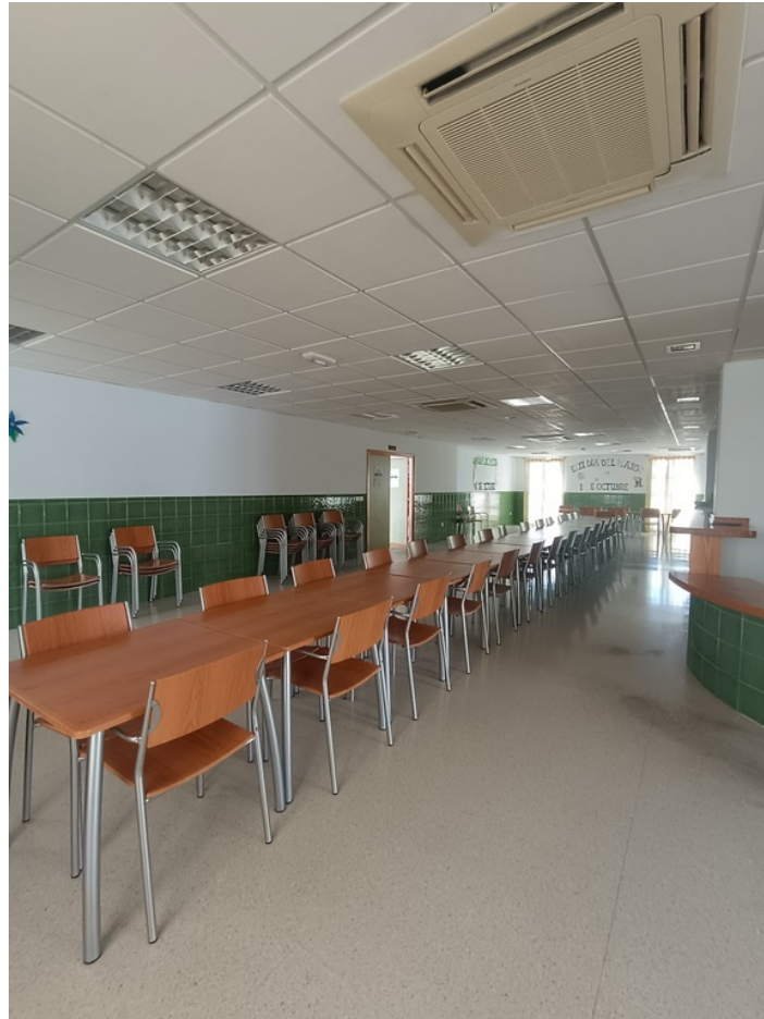
Conjunto mobiliario cafetería Centro de día