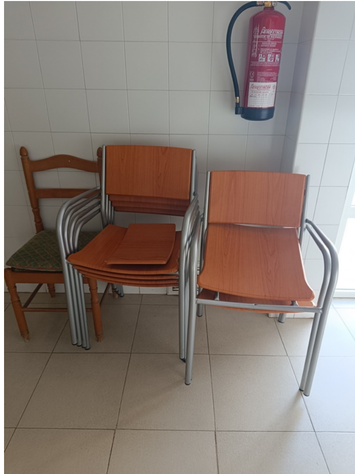
Conjunto mobiliario cafetería Centro de día