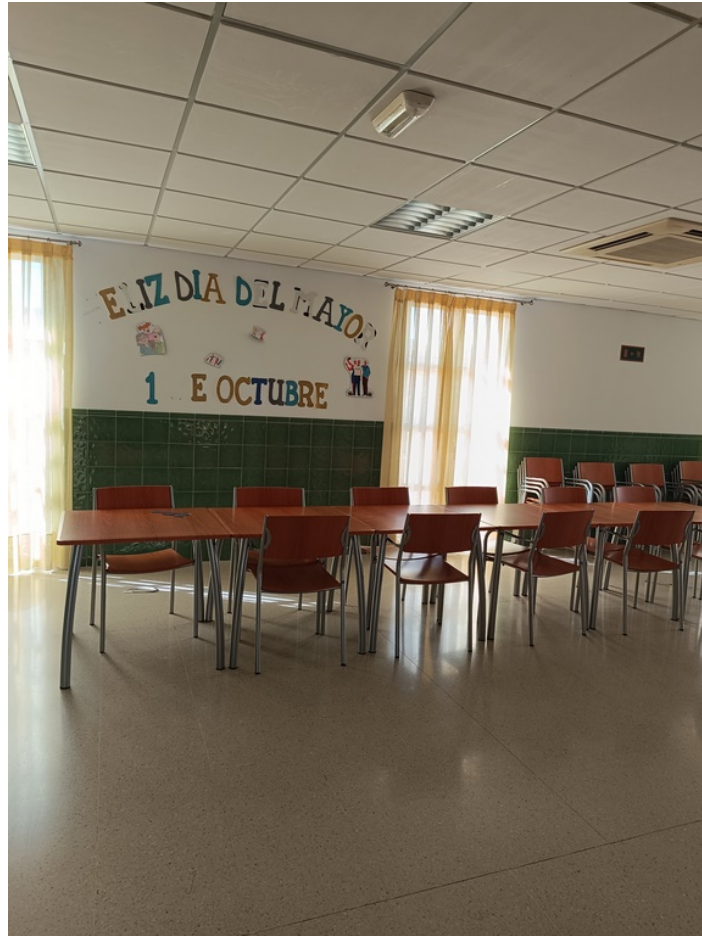
Conjunto mobiliario cafetería Centro de día