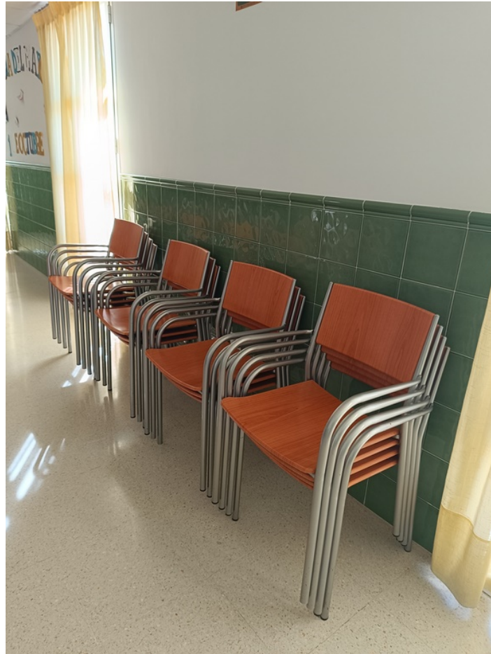
Conjunto mobiliario cafetería Centro de día