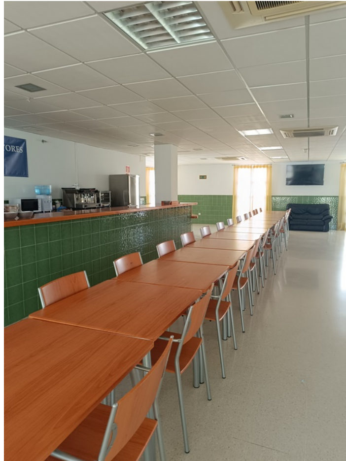
Conjunto mobiliario cafetería Centro de día