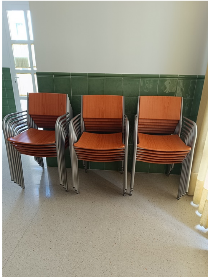
Conjunto mobiliario cafetería Centro de día