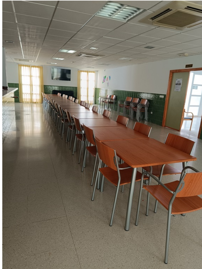
Conjunto mobiliario cafetería Centro de día