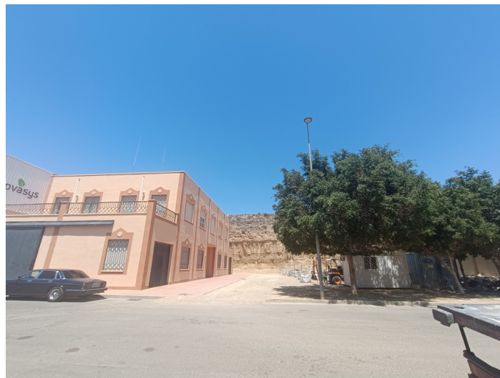
Terreno Centro Iniciativa Empresarial