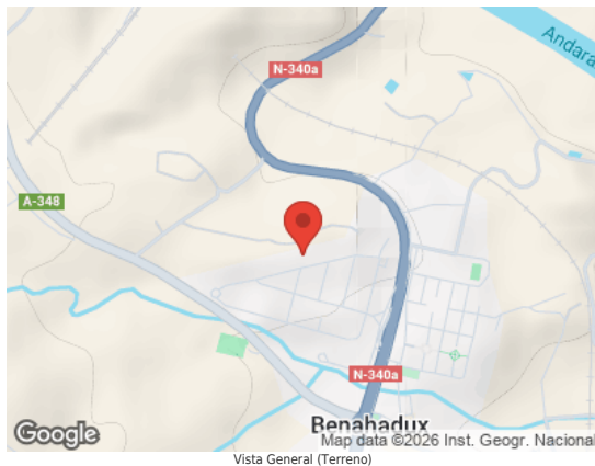
Vista General (Terreno)