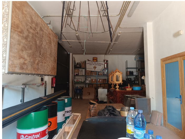
Centro de Iniciativa Empresarial