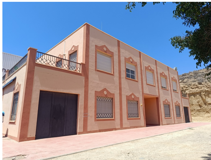
Centro de Iniciativa Empresarial