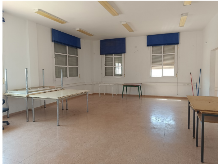
Centro de Iniciativa Empresarial