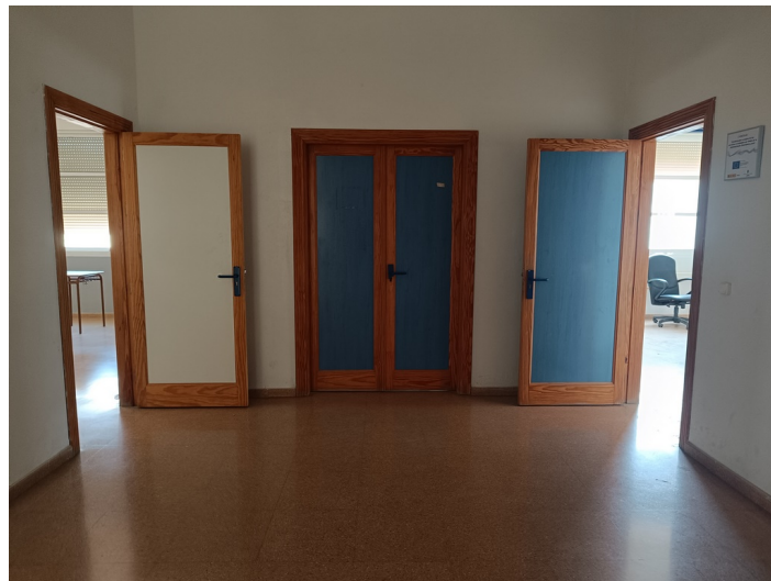
Centro de Iniciativa Empresarial