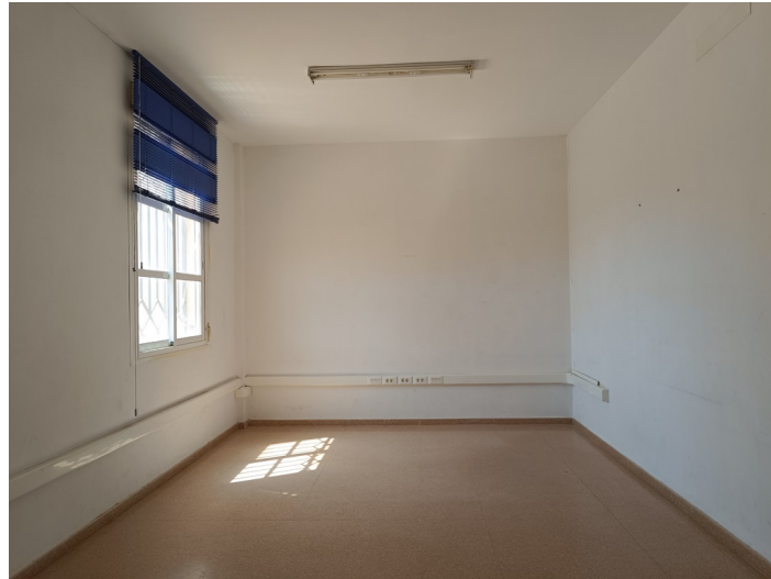
Centro de Iniciativa Empresarial