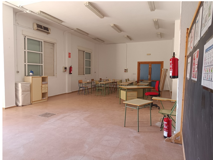
Centro de Iniciativa Empresarial