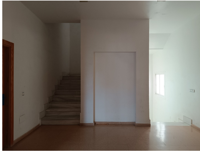
Centro de Iniciativa Empresarial