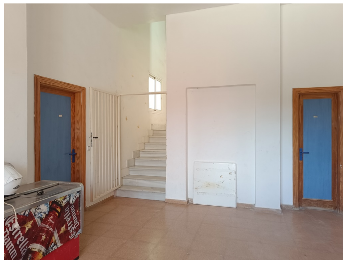
Centro de Iniciativa Empresarial