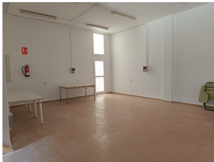
Centro de Iniciativa Empresarial