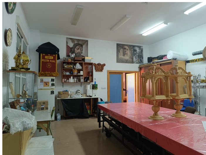
Centro de Iniciativa Empresarial