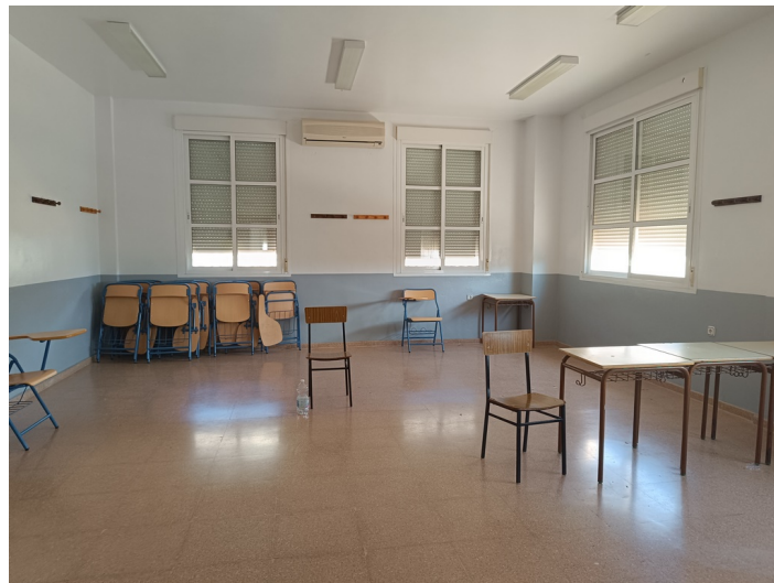
Centro de Iniciativa Empresarial