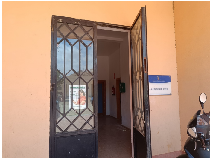
Centro de Iniciativa Empresarial