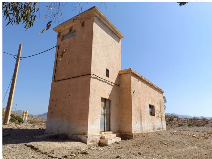
Terreno Transformador eléctrico DS La Viña