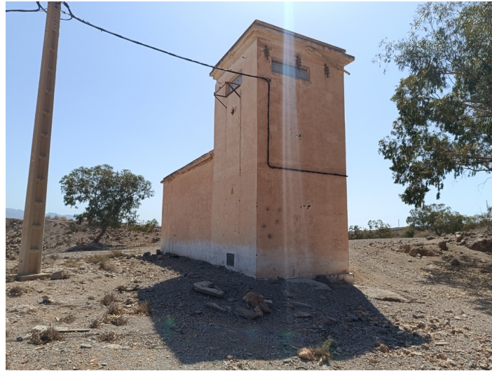
Terreno Transformador eléctrico DS La Viña