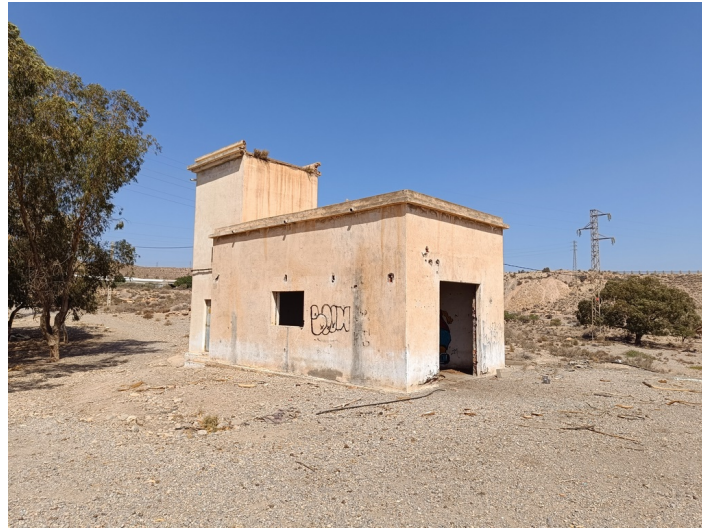
Terreno Transformador eléctrico DS La Viña