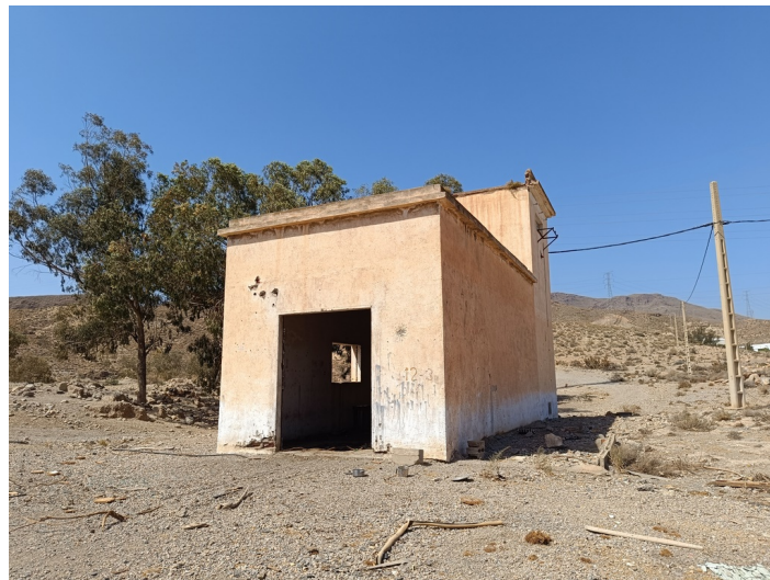
Terreno Transformador eléctrico DS La Viña