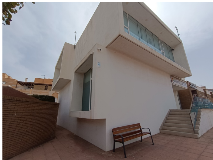
Vista exterior de la fachada