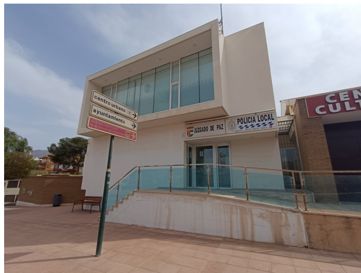
Vista exterior de la fachada