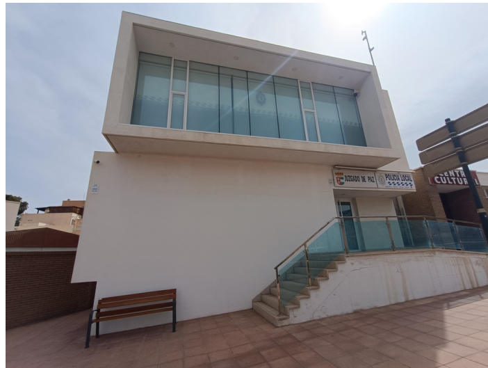
Vista exterior de la fachada