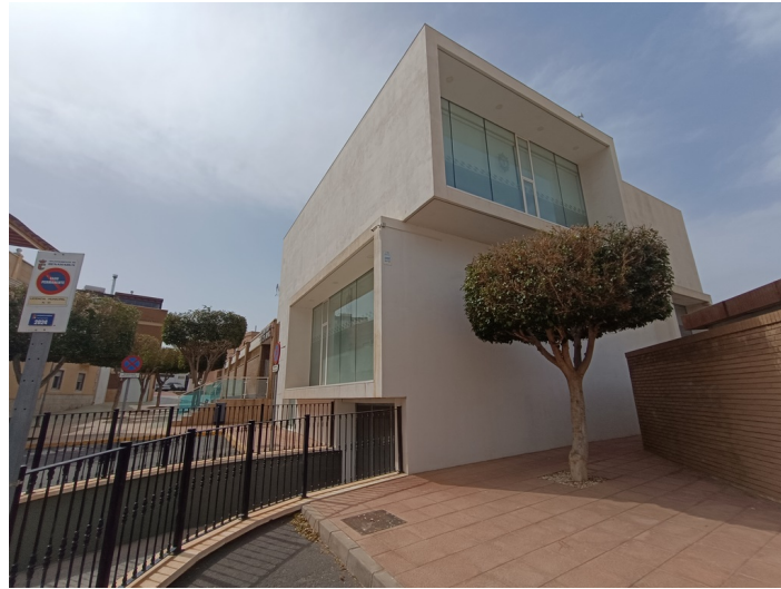
Vista exterior de la fachada