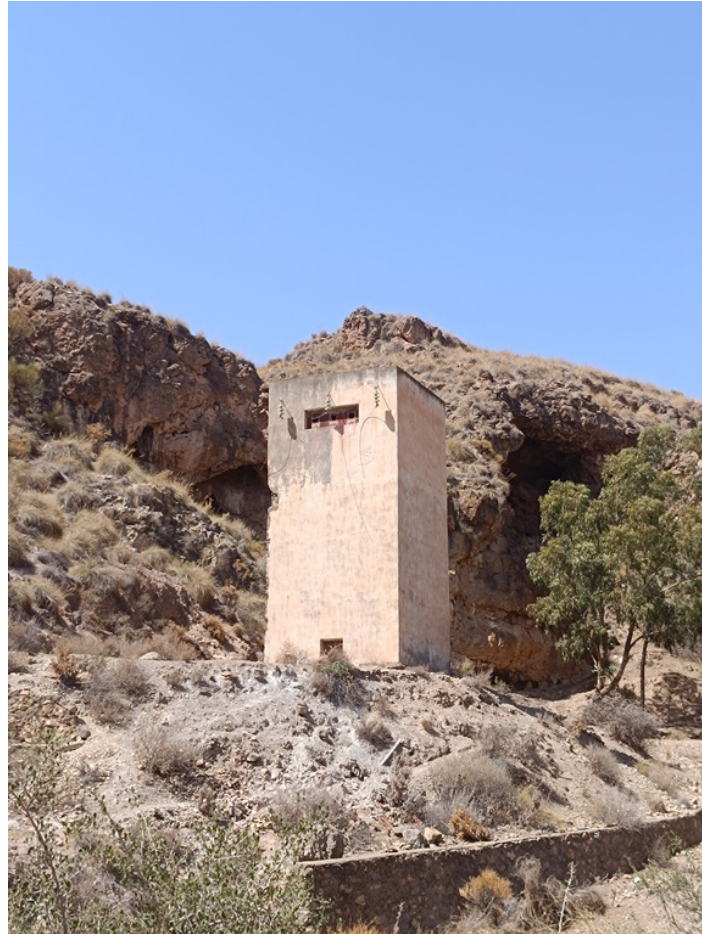
Transformador eléctrico DS La Viña 4