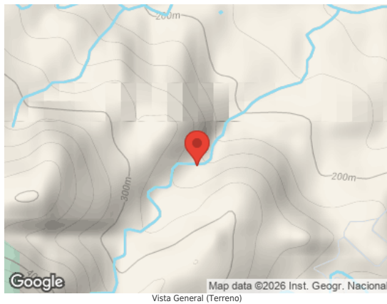
Map data ©2026 Inst. Geogr. Nacional Vista General (Terreno)