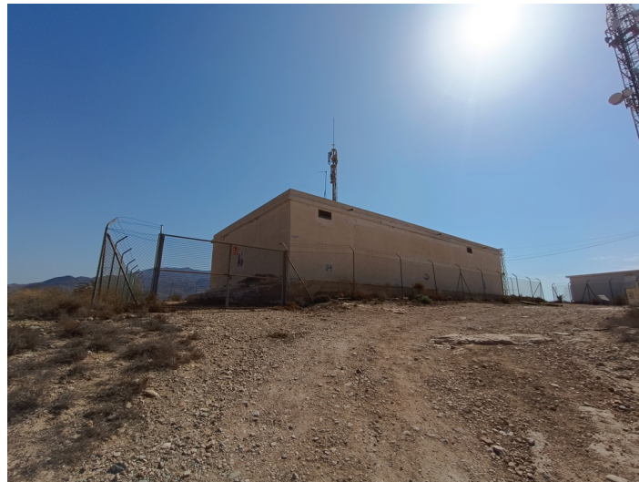
Depósito Nuevo para el Agua