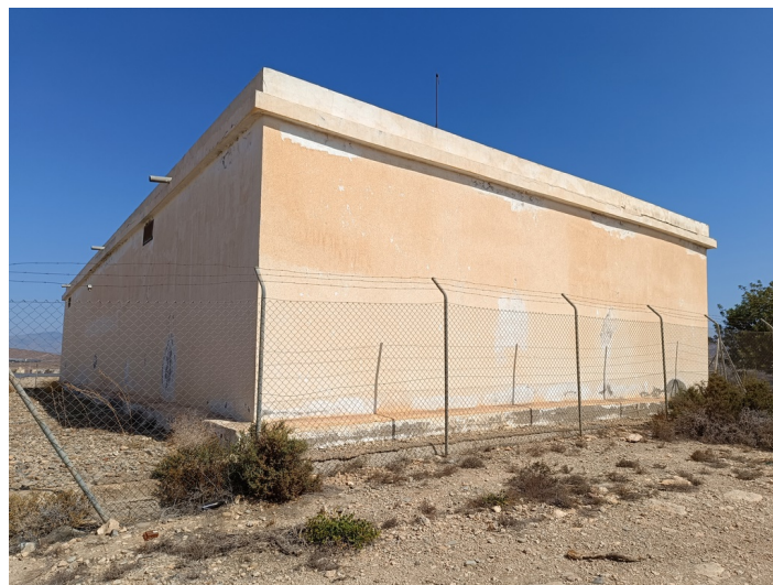
Depósito Nuevo para el Agua