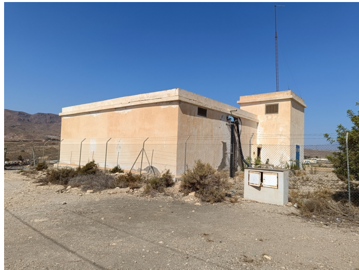
Depósito Nuevo para el Agua