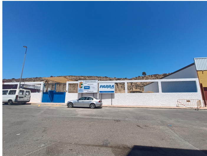
Terreno piscina municipal