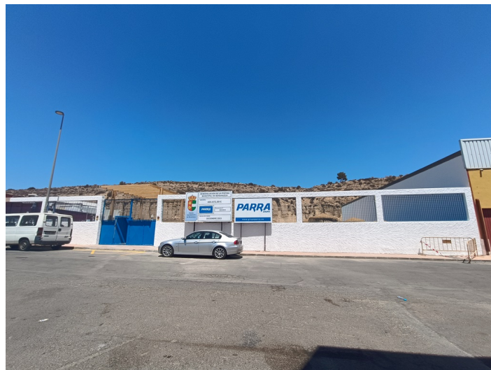
Piscina Municipal I-1 e I-2