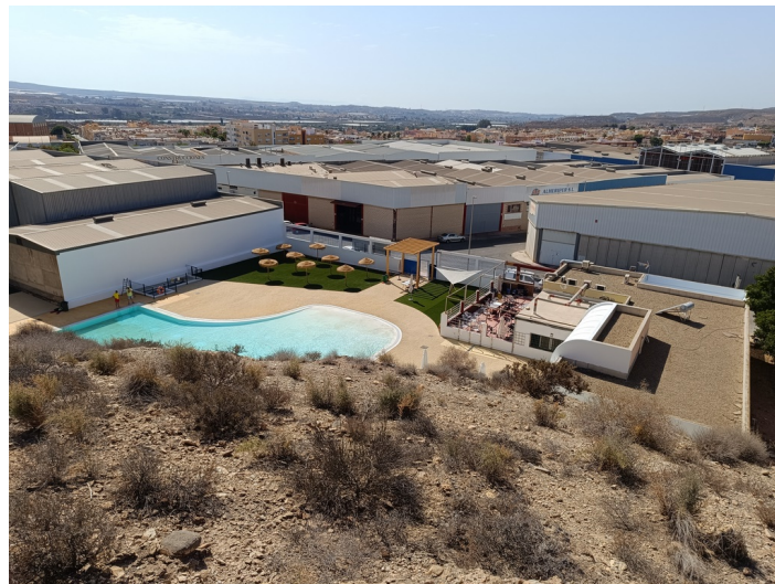
Piscina Municipal I-1 e I-2