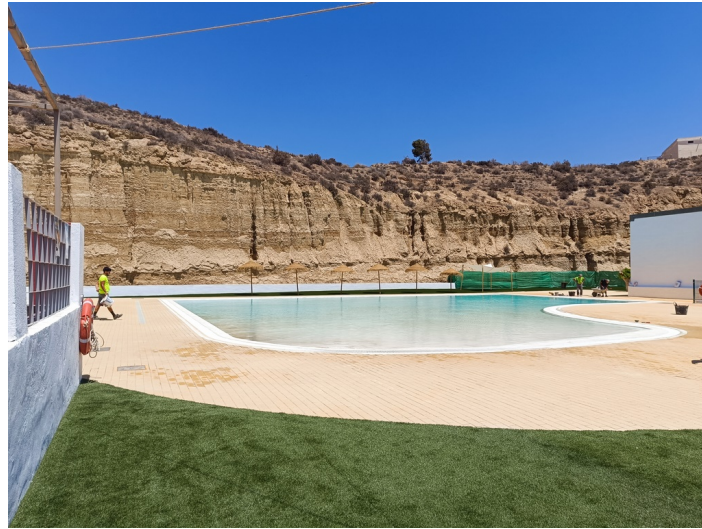
Piscina Municipal I-1 e I-2