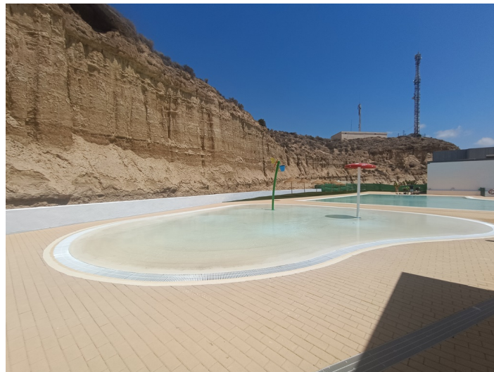
Piscina Municipal I-1 e I-2