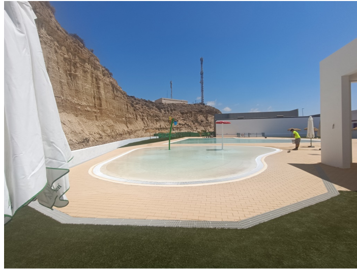
Piscina Municipal I-1 e I-2