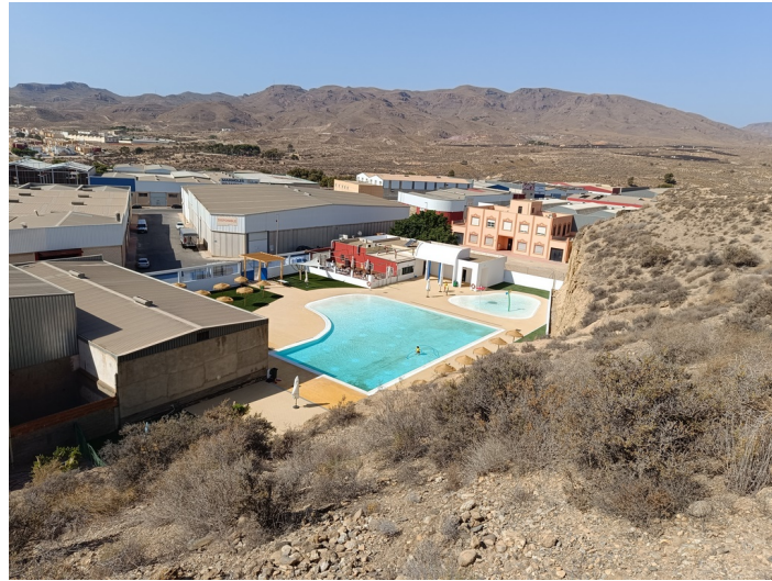
Piscina Municipal I-1 e I-2