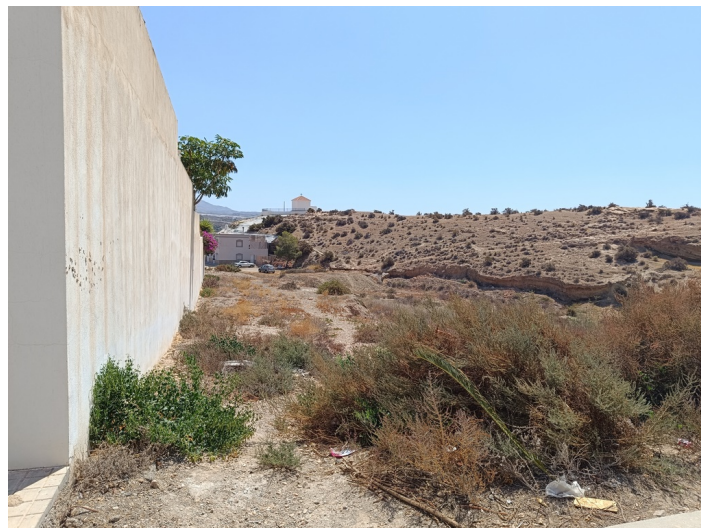
Solar Finca P8 Del Polígono 1 De La Ua-8 C/ Limonero