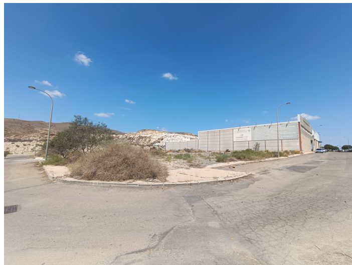
Solar Polígono Sector I-4 Finca P2