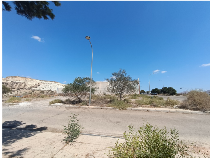
Solar Polígono Sector I-4 Finca P2