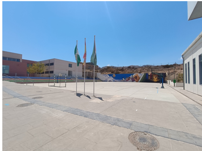
Terreno CEIP Padre Manjón Plaza Manuel Zamora