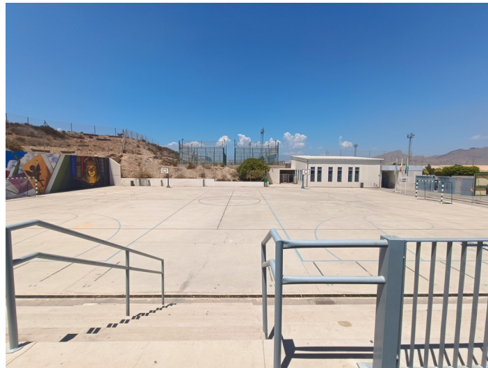
CEIP Padre Manjón Plaza Manuel Zamora