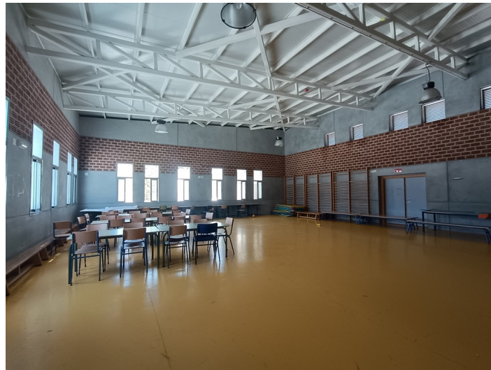
CEIP Padre Manjón Plaza Manuel Zamora