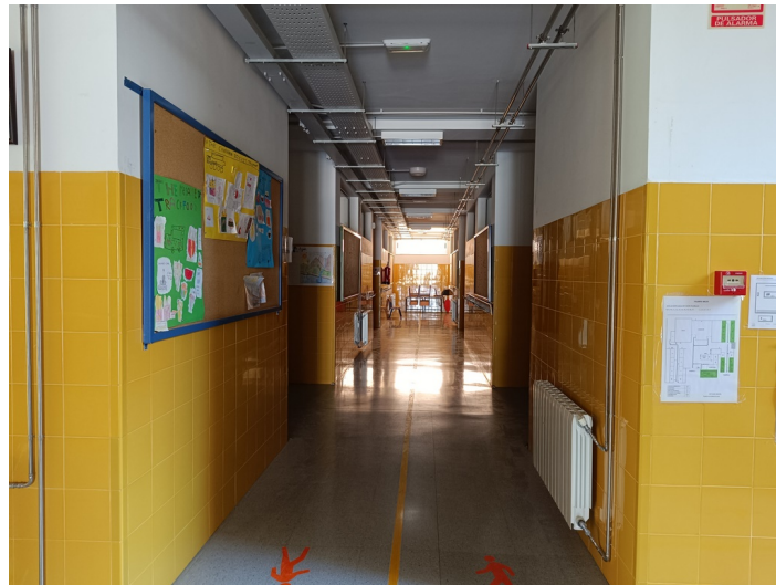
CEIP Padre Manjón Plaza Manuel Zamora