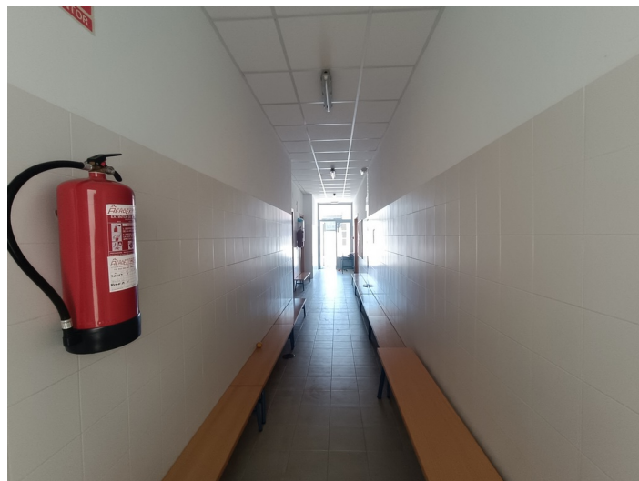
CEIP Padre Manjón Plaza Manuel Zamora