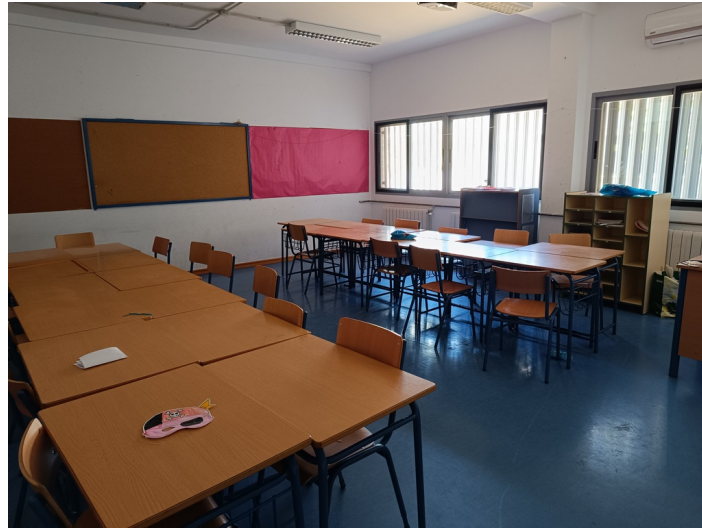
CEIP Padre Manjón Plaza Manuel Zamora