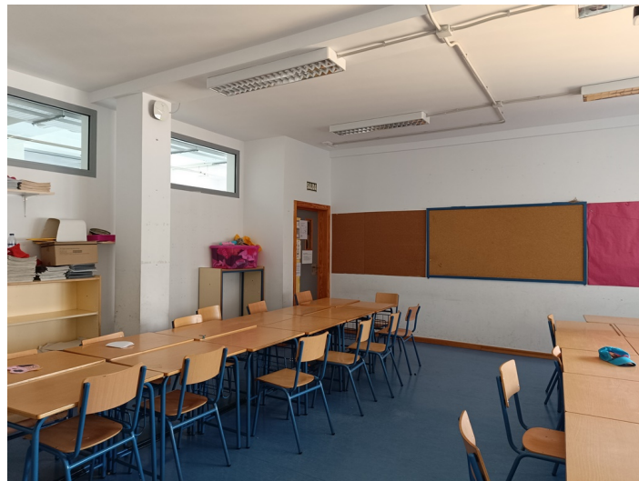
CEIP Padre Manjón Plaza Manuel Zamora