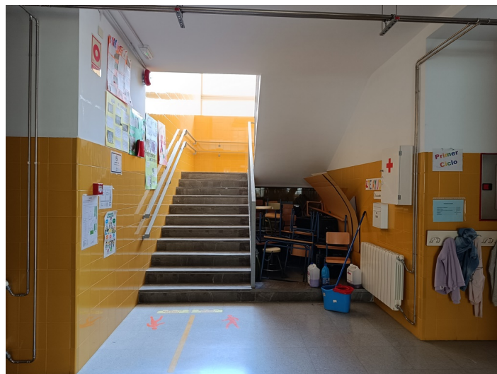
CEIP Padre Manjón Plaza Manuel Zamora