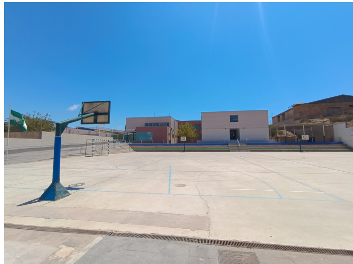
CEIP Padre Manjón Plaza Manuel Zamora