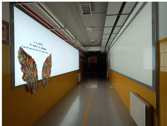
CEIP Padre Manjón Plaza Manuel Zamora