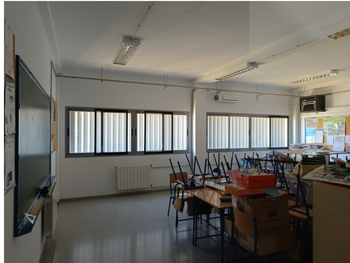
CEIP Padre Manjón Plaza Manuel Zamora