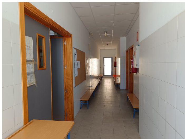
CEIP Padre Manjón Plaza Manuel Zamora