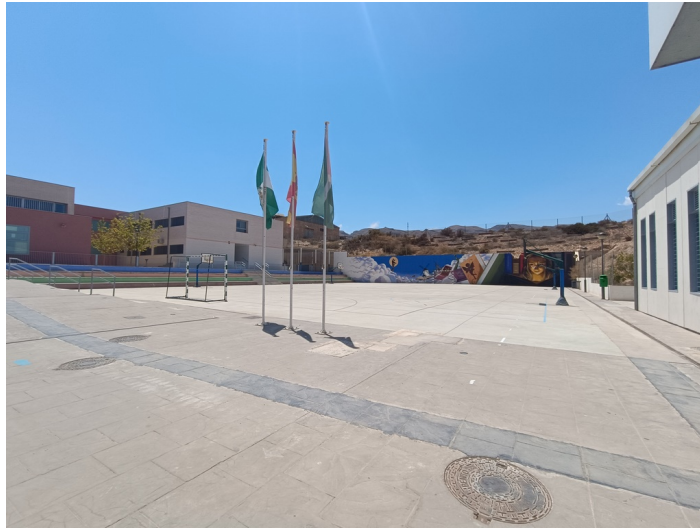
CEIP Padre Manjón Plaza Manuel Zamora