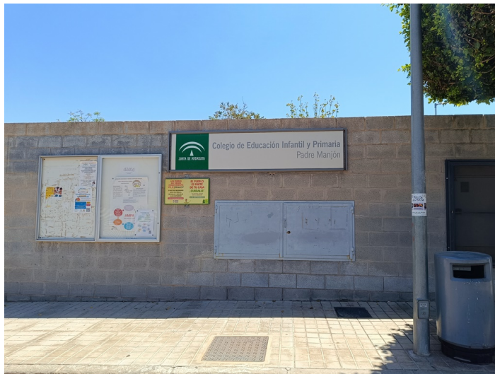
CEIP Padre Manjón Plaza Manuel Zamora