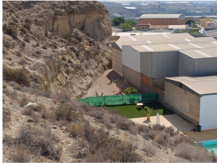
Solar resto de parcela 9. Plan Parcial Sectores I-1 e I-2