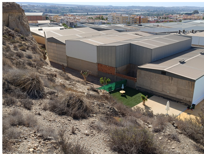
Solar resto de parcela 9. Plan Parcial Sectores I-1 e I-2