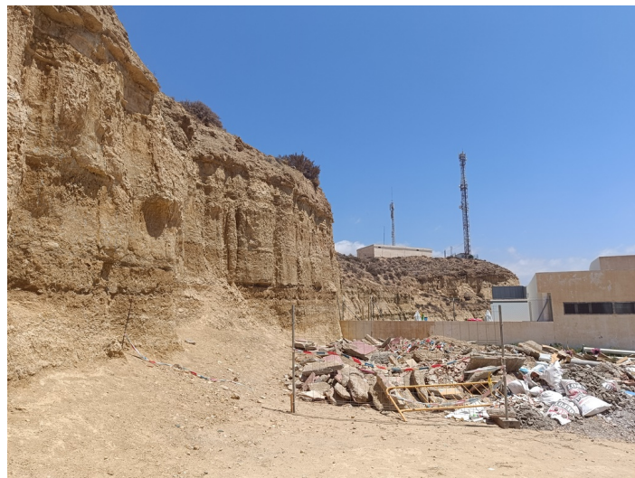
Solar resto de parcela 9. Plan Parcial Sectores I-1 e I-2