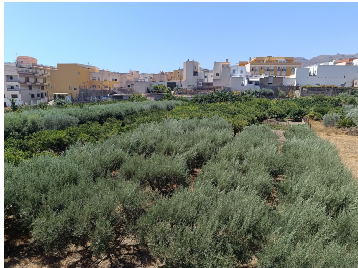
Solar E1 Cesión Ua-1