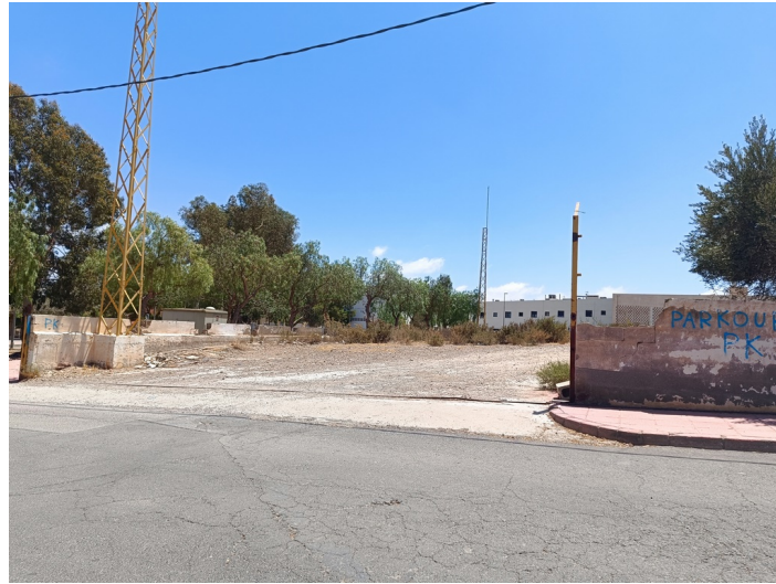
Solar CM Partala UA-15