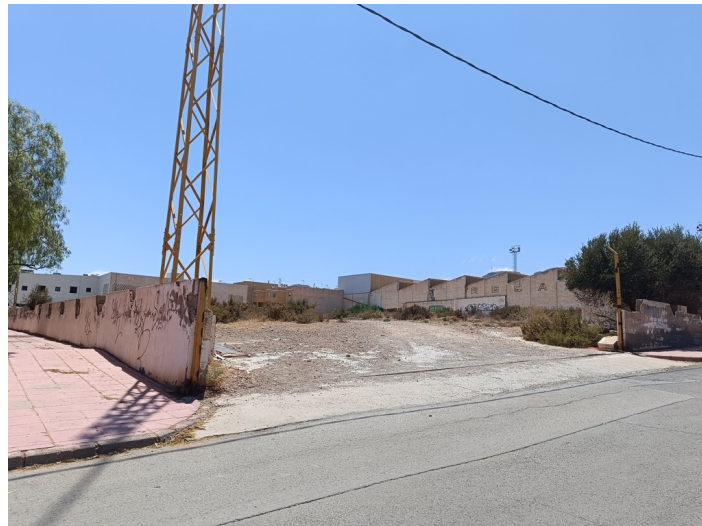
Solar CM Partala UA-15