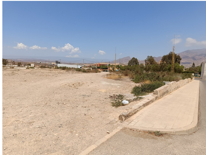
Solar C/ Madreselva (UA-15)