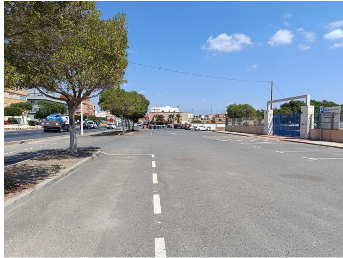
Aparcamientos I E S Aurantia