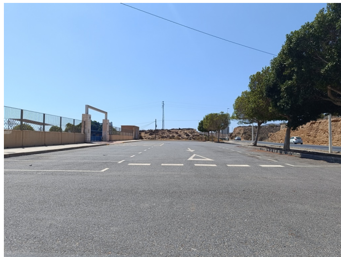
Aparcamientos I E S Aurantia