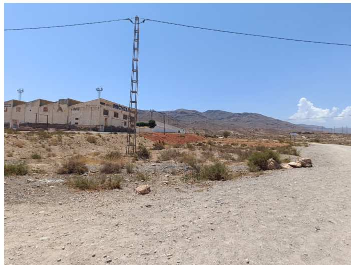
Solar-parcela nº ES (UA-14)