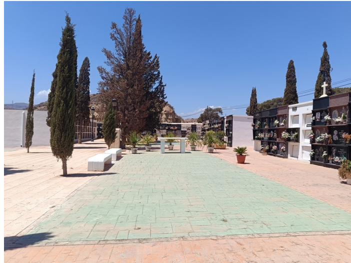
Terreno Cementerio Municipal