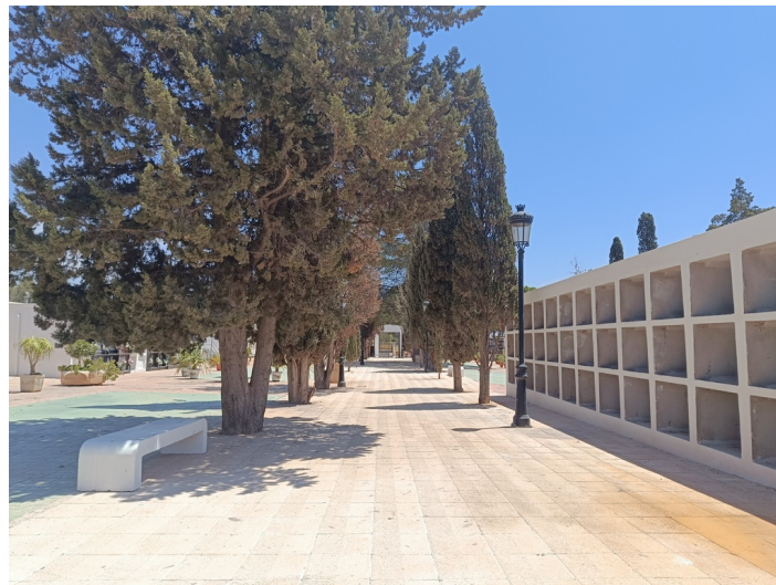
Terreno Cementerio Municipal