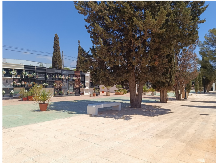
Terreno Cementerio Municipal