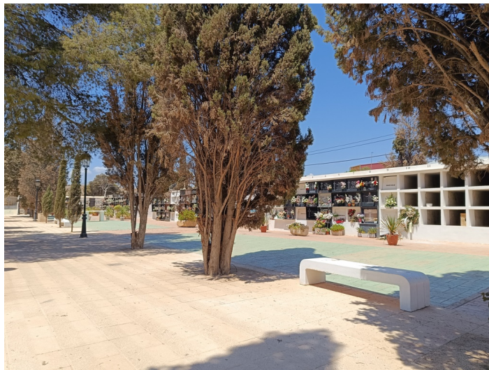
Terreno Cementerio Municipal