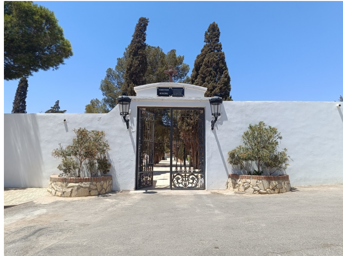
Terreno Cementerio Municipal