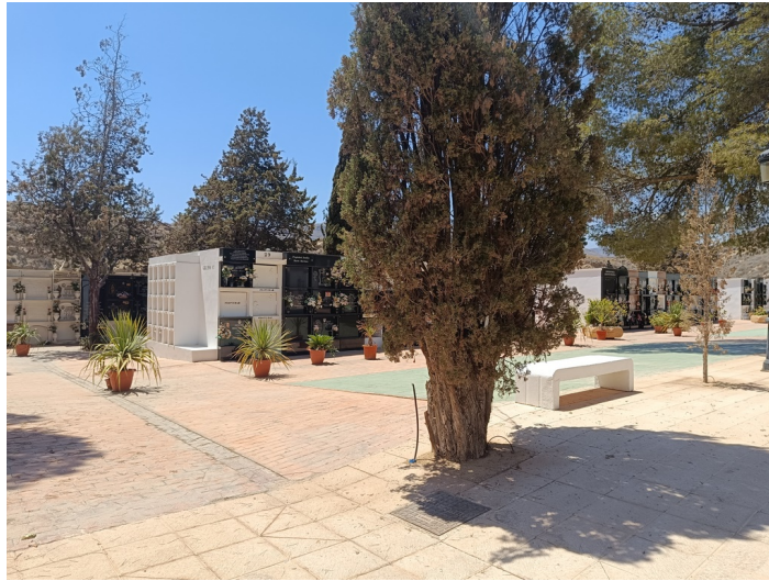
Terreno Cementerio Municipal