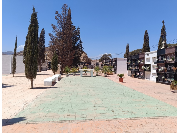
Terreno Cementerio Municipal