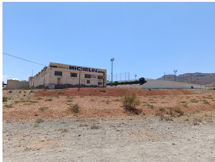
Solar-parcela nº E-D (UA-14)