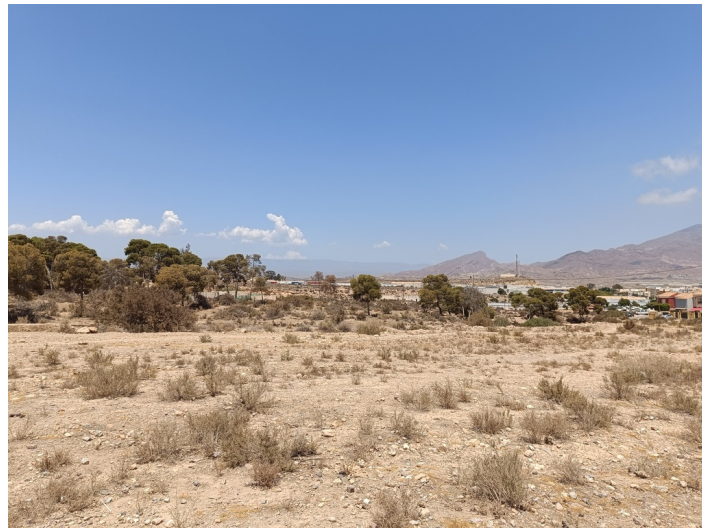
Solar-parcela nº V-2 (UA-14)