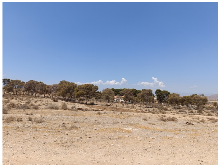
Solar-parcela nº V-1 (UA-14)