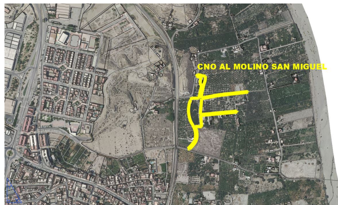
Camino al Molino San Miguel