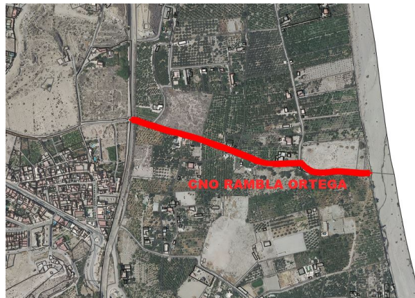
Camino Rambla Ortega