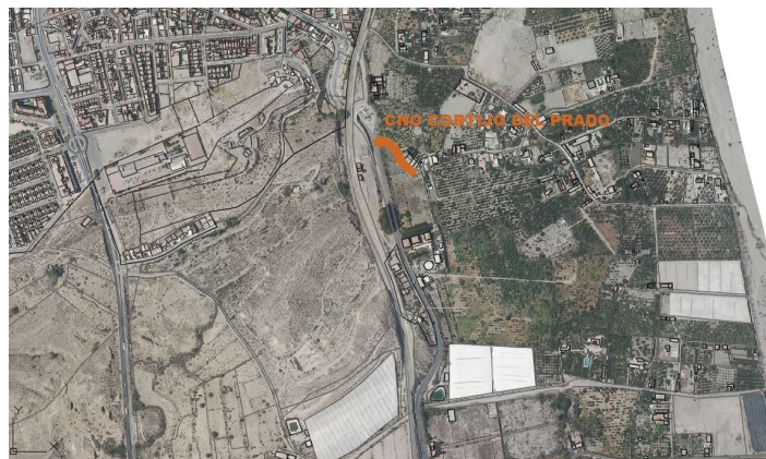
Camino Cortijo del Prado