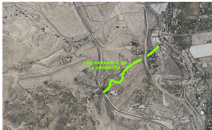
Camino-barranco de la Churruta