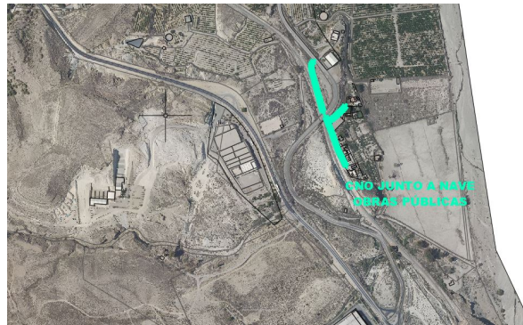
Camino junto a Nave Obras Públicas